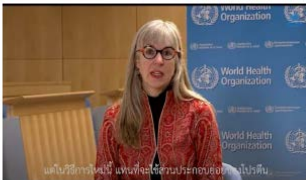
ดร. คัทรีน โอไบรอัน แกไขข่าวลือและความเชื่อเกี่ยวกับวัคซีนโควิด 19 ด้วยวิทยาศาสตร์และข้อเท็จจริง